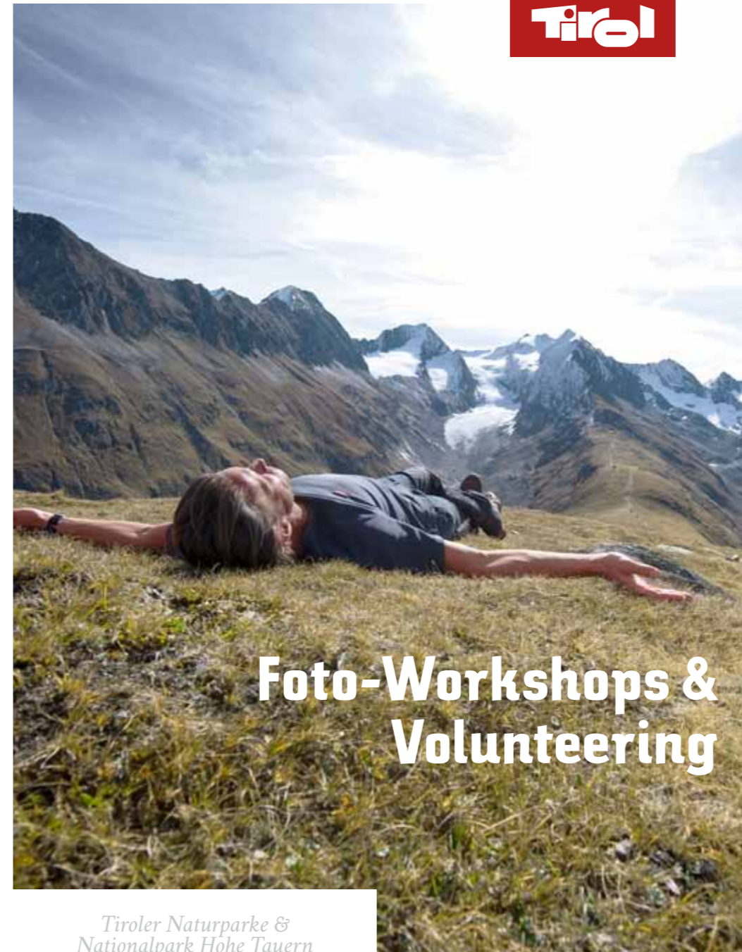
Foto-Workshops & Volunteering

Tiroler Naturparke & Nationalpark Hohe Tauern