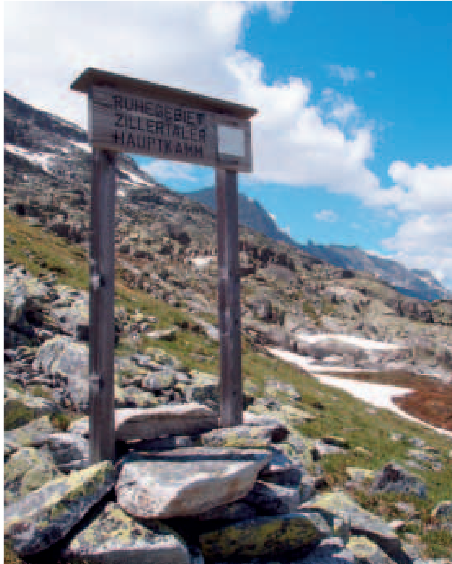
Ruhegebietsstafel in der Hundskehle im Zillertal

Der Oesterreichische Alpenverein (OeAV) wurde im Jahre 1862 in Wien, der Deutsche Alpenverein (DAV) 1869 in München gegründet. Zweck der Alpenvereine ist es damals wie heute, das Bergsteigen und Wandern im Gebirge zu fördern, die Kenntnisse über das Hochgebirge zu erweitern und die Schönheit und Ursprünglichkeit der Bergwelt zu erhalten. Der OeAV ist mit über 300.000 Mitgliedern und 270 Schutzhütten der größte alpine Verein Österreichs. Der DAV betreut über 700.000 Mitglieder und 327 Schutzhütten. Gemeinsam halten der OeAV und der DAV 40.000 km Wanderwege in den österreichischen Alpen in Stand.