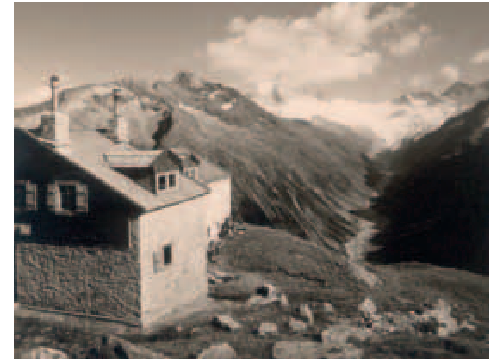
Blick auf die Olpererhütte mit Schlegeisgrund

Die Olpererhütte wurde von der Sektion Prag gebaut und am 07. August 1881 eröffnet. Sie ist nach der Berliner Hütte (1879) die zweitälteste AV-Hütte im Zillertal. Die Einraumhütte war unbewirtschaftet und bot Platz für 8 Matratzen- und 8 Heulager. Die Einrichtung bestand aus einem Tisch, Bänken, einem Schrank und einem eisernen Kochofen. Das Holz für die Feuerung „musste jede Partie“ selbst mitbringen. 1900 verkaufte die Sektion Prag die Olpererhütte zusammen mit der Rifflerhütte für 11.000 Mark an die Sektion Berlin. 1931 und 1976 (seit dem bewirtschaftet) folgten Erweiterungen und Umbauten der Olpererhütte. 2004 verkaufte die Sektion Berlin die Olpererhütte an die Sektion Neumarkt/OPf. Nach der Eigentumsübergabe begannen sofort die Planungen für die Renovierung und Erweiterung. Die Küche, die Sanitäreinrichtungen, die Stromerzeugung, die elektrischen Anlagen und die Abwasserbeseitigung entsprachen nicht mehr den heutigen Anforderungen. Die Planungen gestalteten sich sehr schwierig, da die Bausubstanz durch diverse Um- und Anbauten mit sehr vielen Unwägbarkeiten behaftet war und sehr viele Kompromisse hätten eingegangen werden müssen. So wurde im Sommer 2005 beschlossen, einen Ersatzbau mit ca. 60 Schlafplätzen zu errichten. Dem Abriss der alten Hütte 2006, folgte 2007 der Neubau zusammen mit der nachgeholten 125-Jahrfeier.