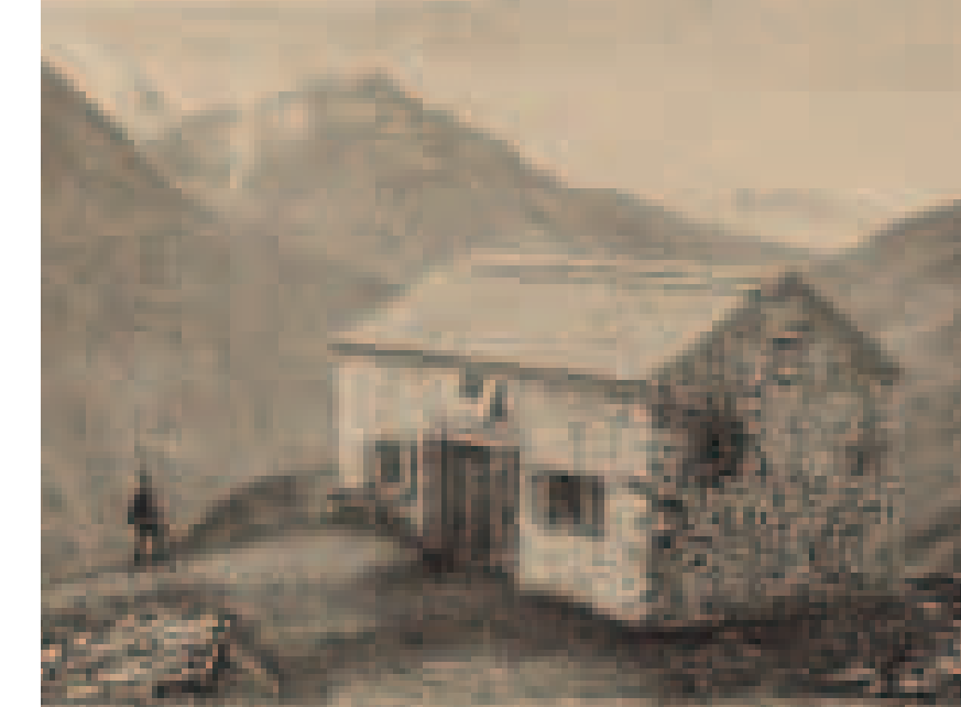
Olperer Hütte 1881