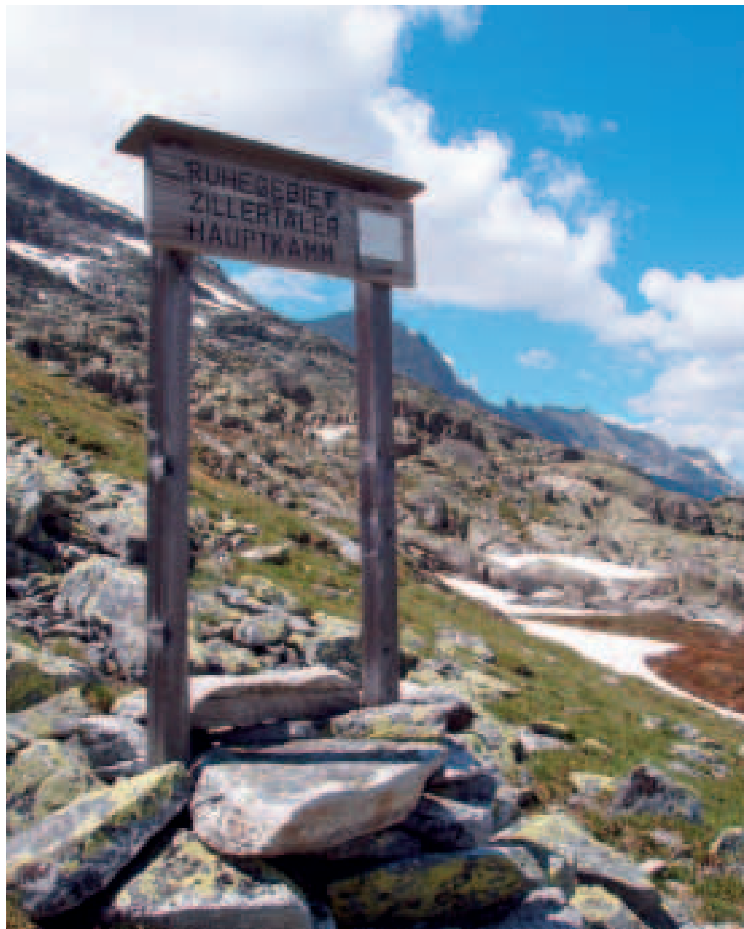
Ruhegebietsstafel in der Hundskehle im Zillertal

Der Oesterreichische Alpenverein (OeAV) wurde im Jahre 1862 in Wien, der Deutsche Alpenverein (DAV) 1869 in München gegründet. Zweck der Alpenvereine ist es damals wie heute, das Bergsteigen und Wandern im Gebirge zu fördern, die Kenntnisse über das Hochgebirge zu erweitern und die Schönheit und Ursprünglichkeit der Bergwelt zu erhalten. Der OeAV ist mit über 300.000 Mitgliedern und 270 Schutzhütten der größte alpine Verein Österreichs. Der DAV betreut 700.000 Mitglieder und 327 Schutzhütten. Gemeinsam halten der OeAV und der DAV 40.000 km Wanderwege in den österreichischen Alpen in Stand.