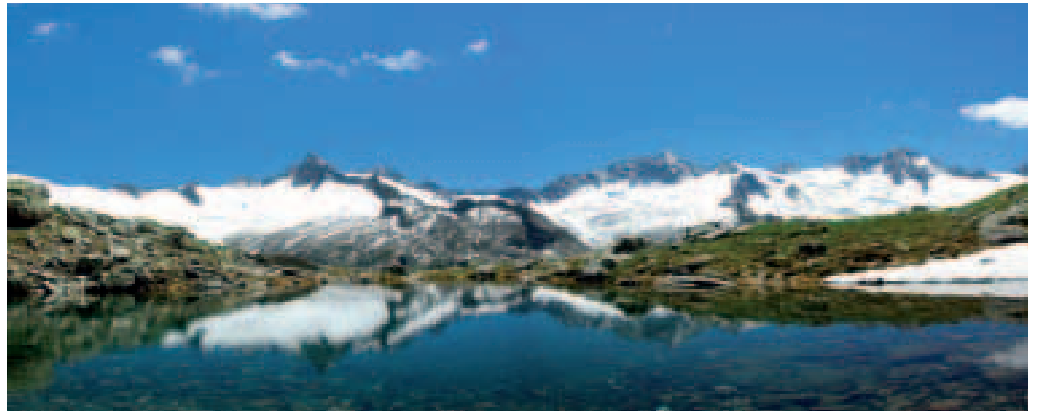
Blick vom Schwarzsee Richtung Zillertaler Hauptkamm

„Schutzgebiet zwischen grünen Tälern und weißen Gletscherriesen“. Zur Erhaltung dieser imposanten und wertvollen (Hoch-)Gebirgslandschaft am Zillertaler Hauptkamm sind im Naturpark harte Erschließungen verboten, dazu zählen vor allem Liftinfrastruktur zur Personenbeförderung, der Neubau öffentlicher Straßen, Lärm erregende Betriebe oder Hubschrauberflüge zu touristischen Zwecken. Mit den benachbarten Schutzgebieten, dem Nationalpark Hohe Tauern sowie dem Naturpark Rieserferner Ahrn bildet der Naturpark mit ca. 2.500 km 2 den größten Schutzgebietsverbund der Alpen.