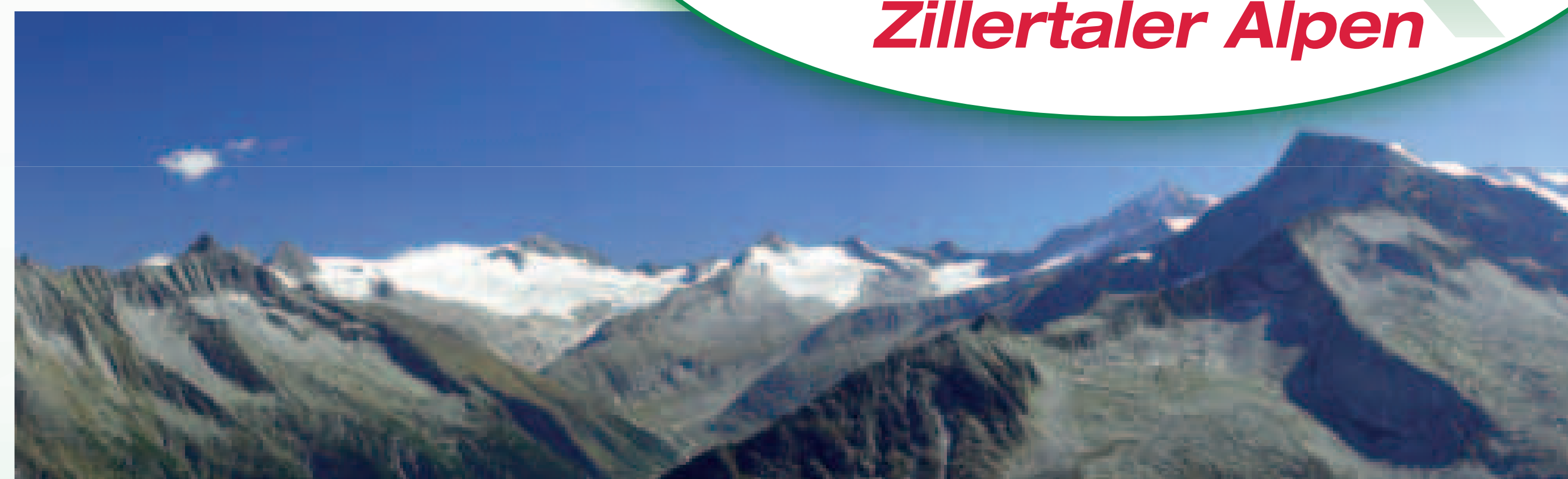
Panorama Richtung Zemmgrund mit Schwarzenstein

Heute präsentiert sich das Petersköpfl dem Wanderer als „mystischer“ Garten, in dem besonders bei Sonnenaufgang eine zauberhafte Atmosphäre herrscht. Ihre ursprüngliche Bedeutung ist bis heute nicht hinreichend geklärt, vielleicht haben Sie ja eine eigene neue Theorie?