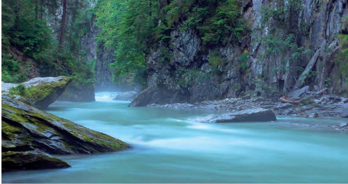
Die Zemmenschlucht bei Mayrhofen

NZ: Seit einigen Wochen gibt es kontroverse Diskussionen vor allem um das Verbund-Projekt Tuxbach-Stilluptal. Kannst Du uns kurz beschreiben, was da geplant ist?