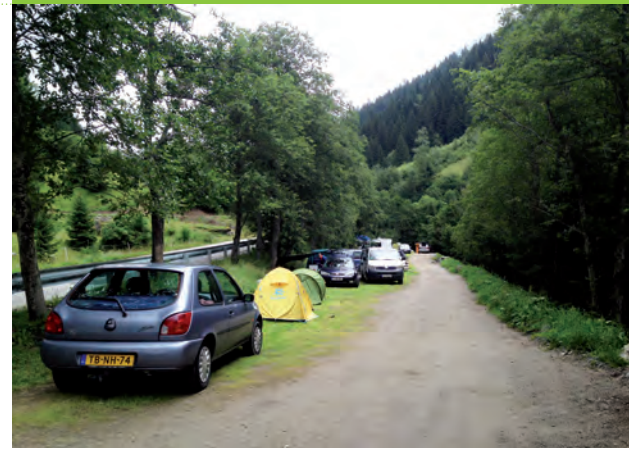
Der neue Campingbereich „Ewige Jagdgründe“ wird bereits sehr gut angenommen

Ein wichtiger Baustein, um das Campieren in geregelte Bahnen zu lenken.