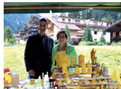
Schwierige Verhältnisse beim Steinbockmarsch. Bild 2: Die Sieger des Steinbockmarsches Bild 4: Der Naturpark-Wandertag – beliebt bei Familien | Bild 5 & 6: Naturparkfest in Ginzling

Naturparkfest mit Schwerpunktthema „Bienen“