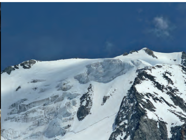
Der Gipfel des Großen Mösele (3.480 m) mit dem Furtschaglkees

Infobroschüre ist bereits in Vorbereitung